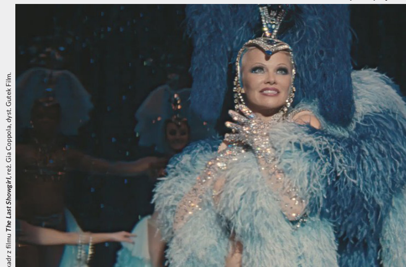
kadry z filmu The Last Showgirl , reż. Gia Coppola, dykt. Gutek Film