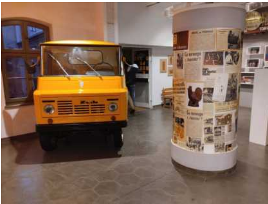
Charakterystycznym elementem przestrzeni jest samochód marki Żuk, służący w okresie PRL do rozwożenia toruńskich pierników do sklepów. Zwiedzający mogą zajrzeć do środka pojazdu, przyglądając się z bliska desce rozdzielczej z minionych lat. Klimatu epoki dopełnia słup ogłoszeniowy z reprodukcjami artykułów o Fabryce Kopernik.