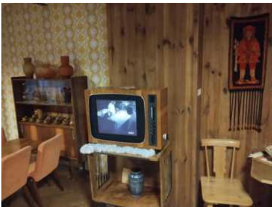
W rekonstrukcji kawiarenki z okresu PRL umieszczony został telewizor, na którym wyświetlane są kroniki filmowe dotyczące produkcji pierników w toruńskich zakładach.