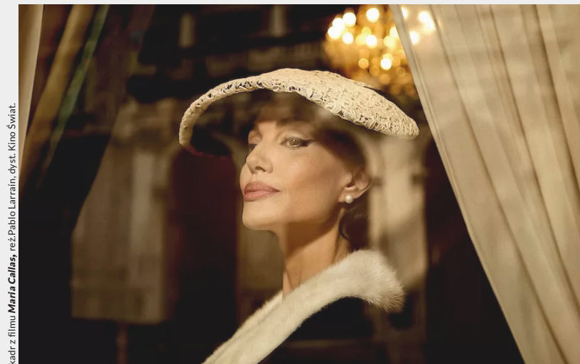
kadr z filmu Maria Callas , rez. Pablo Larrain, dyst. Kino Świat.