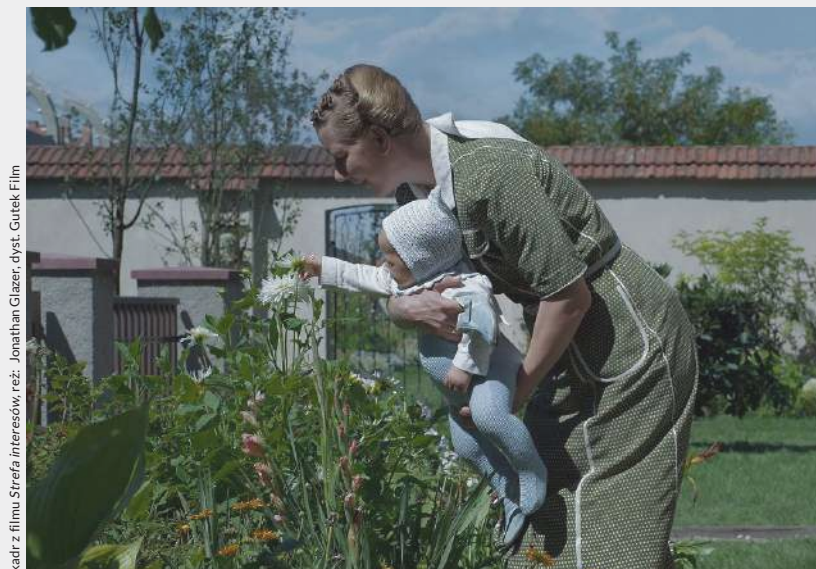
Kadr z filmu Strefa interesów , reż. Jonathan Glazer, dykt. Gutek Film