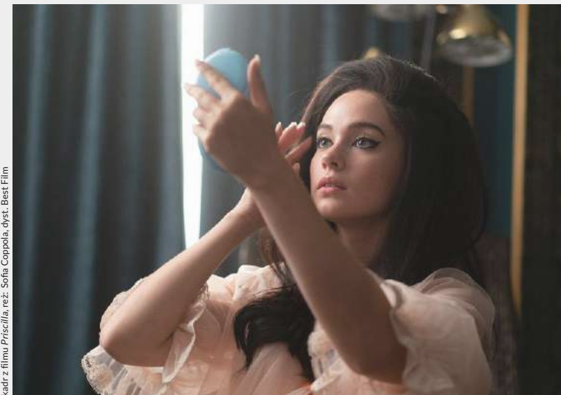
kadrz z filmu Priscilla, rez. Sofia Coppola, dyst. Best Film