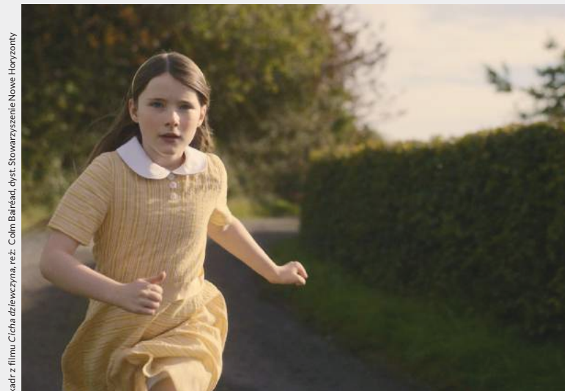
kadr z filmu Cicha dziewczyna , reż. Colin Baird, dykt. Stowarzyszenie Nowe Horyzonty