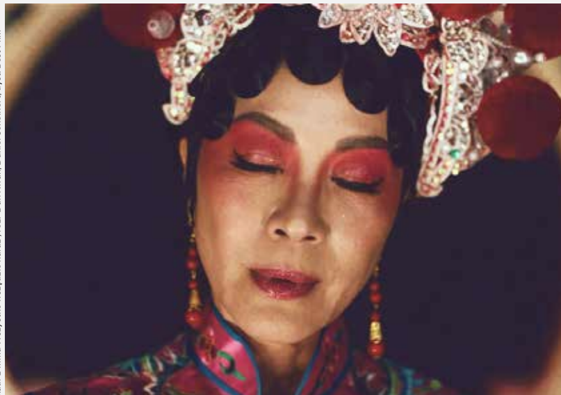
kadr z filmu Wszystko wszędzie naraz , reż. Dan Kwan, Daniel Scheinert, dyst. Best Film